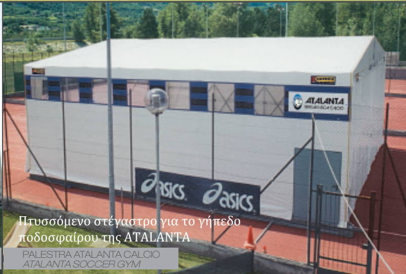
Πτυσσόμενο στέγαστρο για το γήπεδο ποδοσφαίρου της ATALANTA

PALESTRA AC CHIEVO VERONA AC CHIEVO VERONA GYM