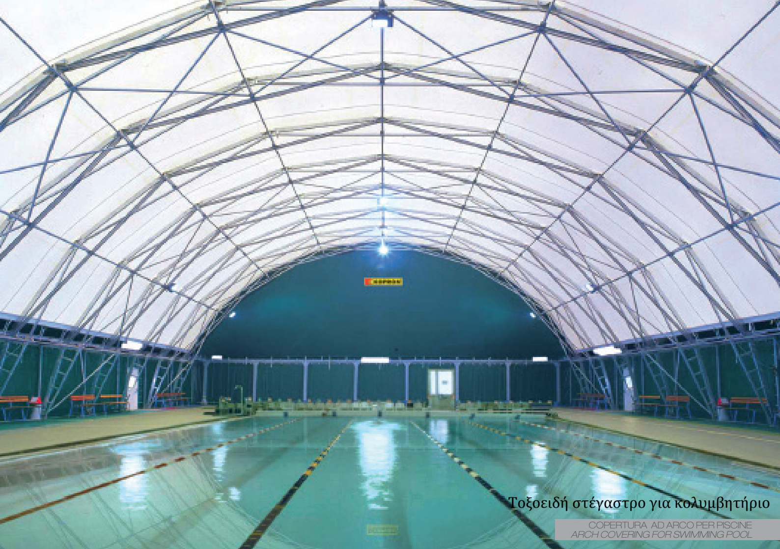
Τοξοειδή στέγαστρο για κολυμβητήριο

COPERTURA AD ARCO PER PISCINE ARCH COVERING FOR SWIMMING POOL