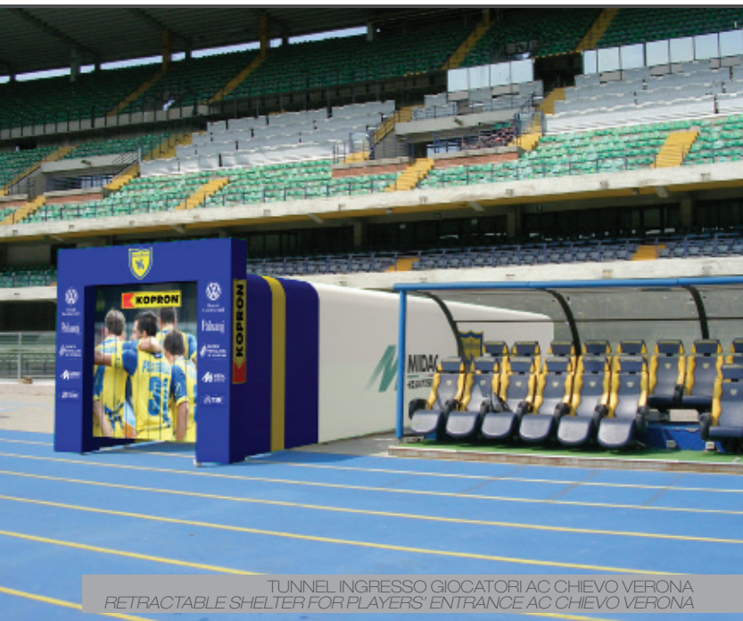
TUNNEL INGRESSO GIOCATORI AC CHIEVO VERONA RETRACTABLE SHELTER FOR PLAYERS' ENTRANCE AC CHIEVO VERONA