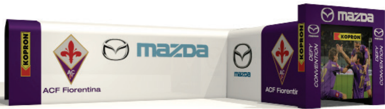
Πτυσσόμενες φουσόνες για την είσοδο των ποδοσφαιριστών της ACF FIORENTINA.