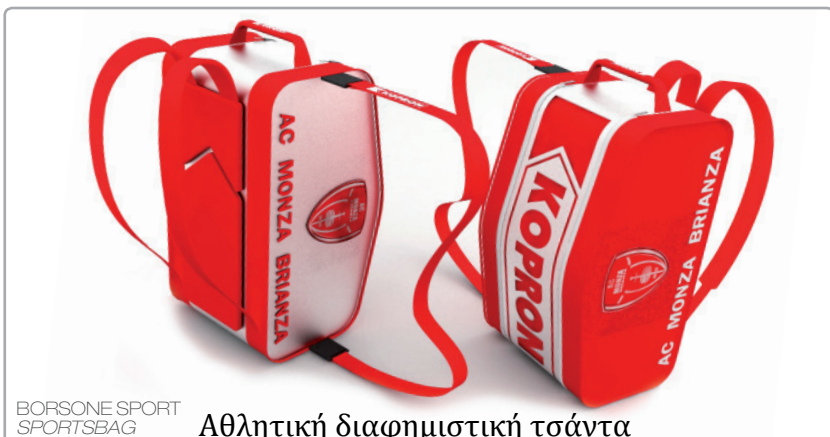
Αθλητική διαφημιστική τσάντα