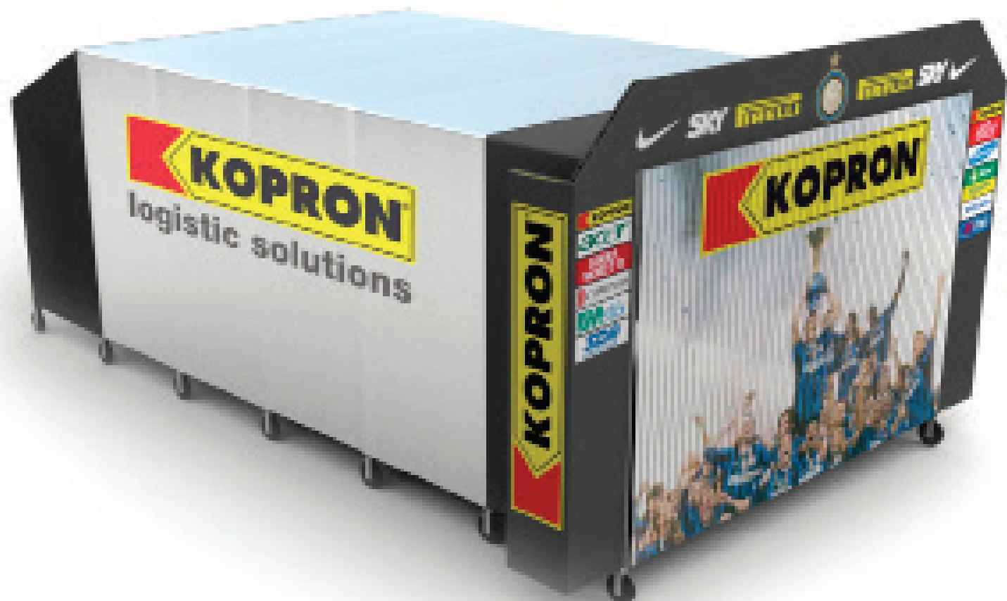
TUNNEL INGRESSO GIOCATORI FC INTERNAZIONALE RETRACTABLE SHELTER FOR PLAYERS' ENTRANCE FC INTERNAZIONALE