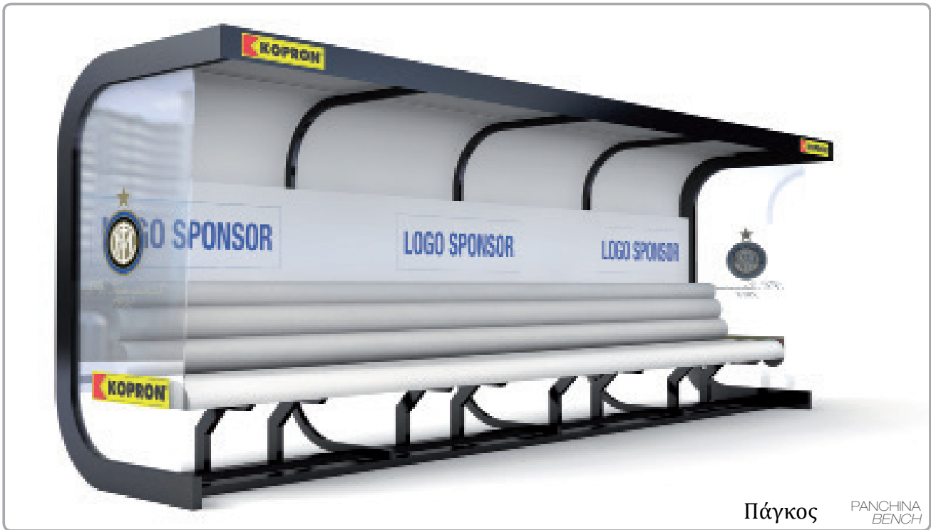
Πάγκος PANCHINA BENCH