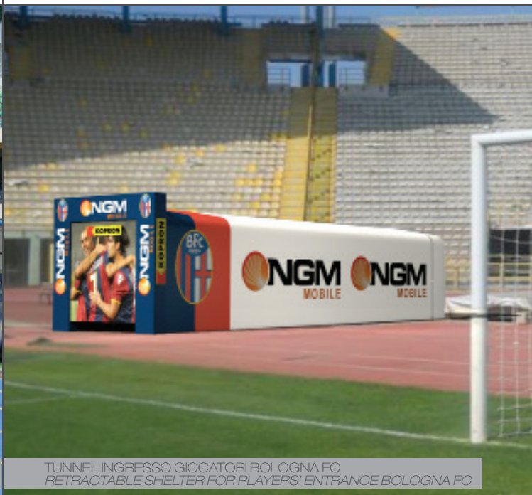
TUNNEL INGRESSO GIOCATORI BOLOGNA FC RETRACTABLE SHELTER FOR PLAYERS' ENTRANCE BOLOGNA FC