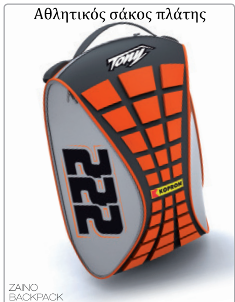
Αθλητικός σακός πλάτης