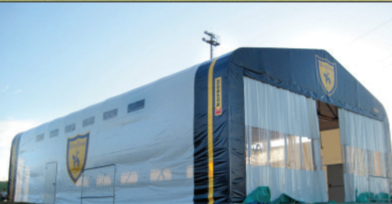
Πτυσσόμενο στέγαστρο για το γυμναστήριο της AC CHEVO VERONA

PALESTRA AC CHIEVO VERONA AC CHIEVO VERONA GYM