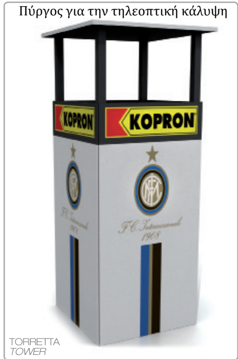
Πύργος για την τηλεοπτική κάλυψη