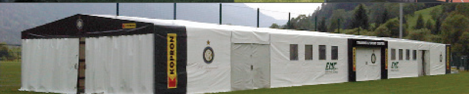
Πτυσσόμενο στέγαστρο για το γήπεδο της FC INERNAZIONALE

PALESTRA ATALANTA CALCIO ATALANTA SOCCER GYM