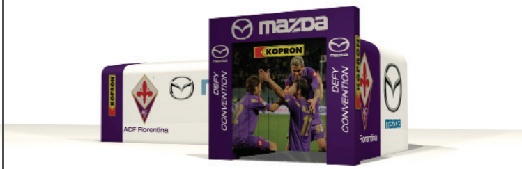
TUNNEL INGRESSO GIOCATORI ACF FIORENTINA RETRACTABLE SHELTER FOR PLAYERS' ENTRANCE ACF FIORENTINA