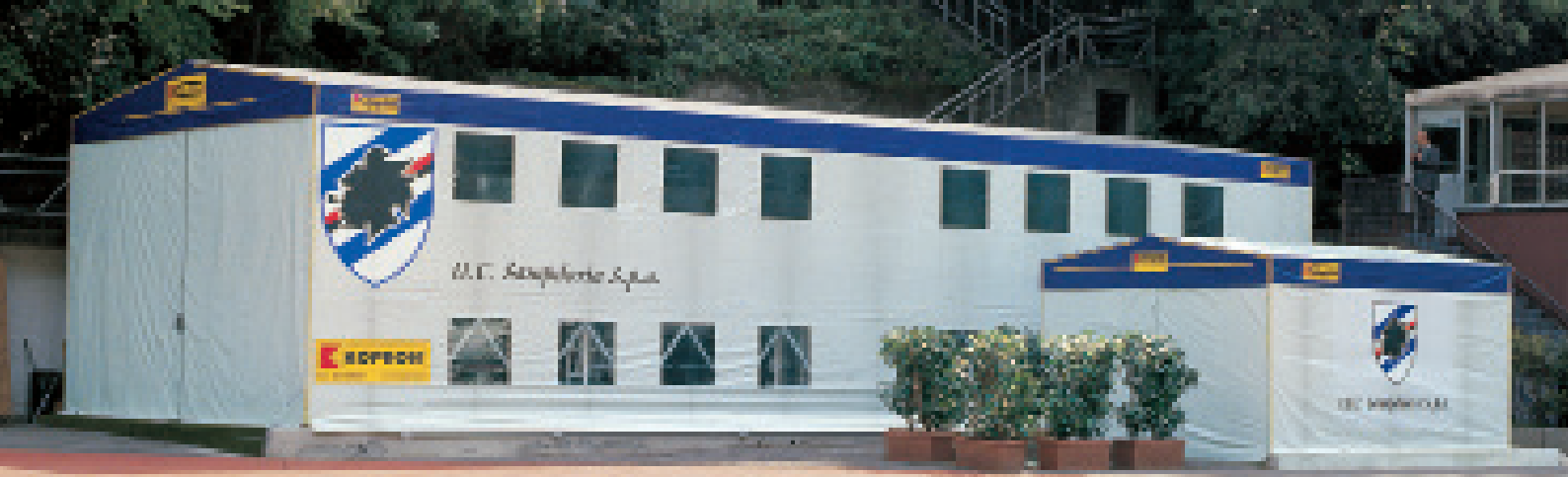
Πτυσσόμενο στέγαστρο για το γυμναστήριο της UC SAMPDORIA