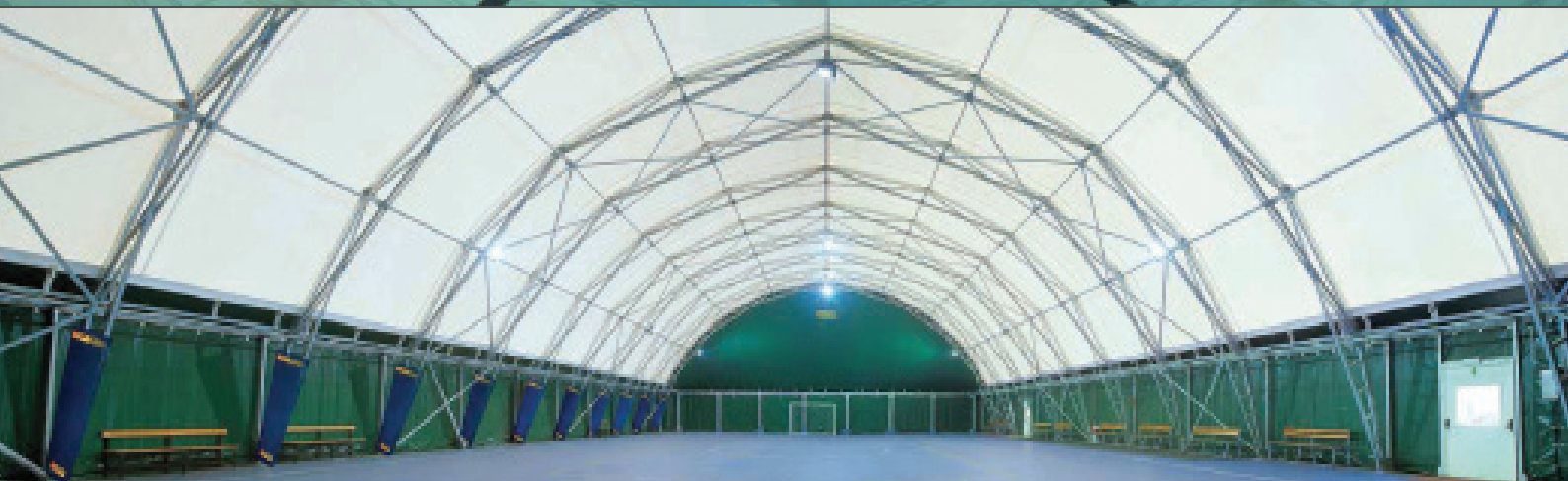
Τοξοειδή στέγαστρο για κλειστό γήπεδο ποδοσφαίρου

COPERTURA AD ARCO PER PISCINE ARCH COVERING FOR SWIMMING POOL